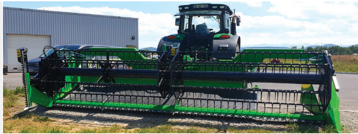
Version 1 sortie